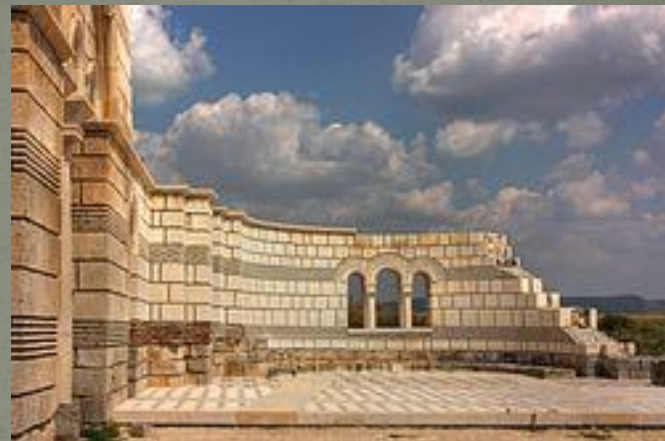
Колона, останала от Тронната зала в Преслав