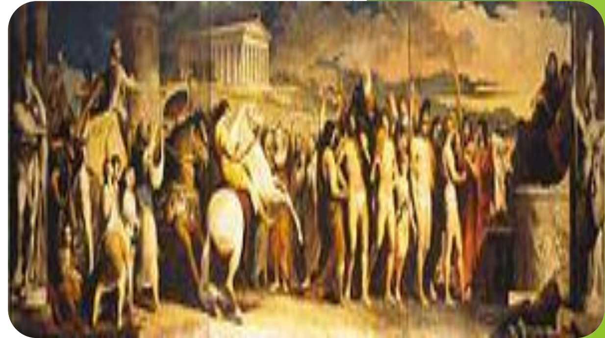
Награждаване на победителите от олимпийските игри